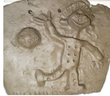
Otroški likovni deli