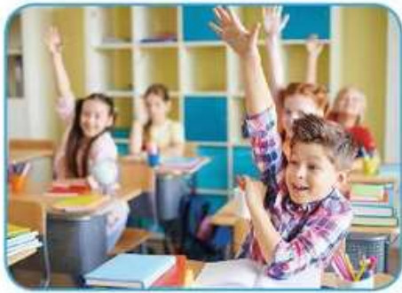
želja po znanju, obvezno osnovno šolstvo ...