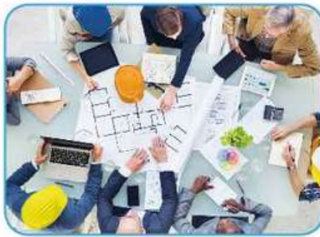
želja po delu, uspehu podjetja, zaslužek