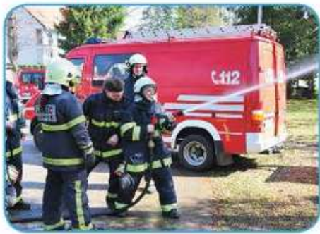
pomagati ljudem v nesreči