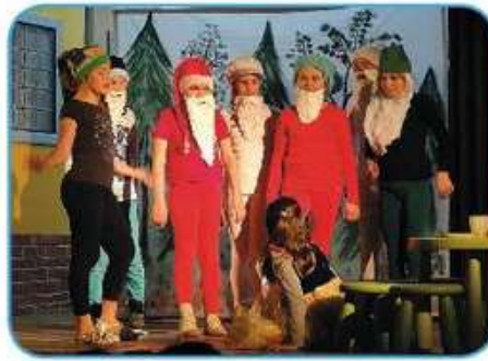
želja po ustvarjanju/gledališki igri/nastopanju ...