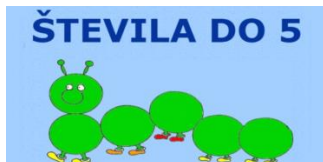
POZNAM ŠTEVILA DO 5